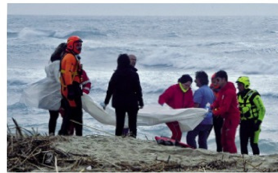
I volontari della Croce Rossa calabrese e personale del 118 soccorrono i superstiti del naufragio del peschereccio a Staccato di Cutro, nel Crotonese

Crotone Almeno 59 morti e dispersi, tanti i bimbi Il barcone si spezza a 100 metri dalla riva: la strage dei migranti